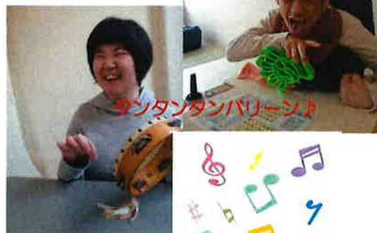
ウクレレバレーン♪