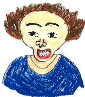
代表 西島 亜希