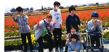
花に負けるな～!!ピース