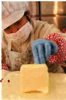
慎重に分量測っています