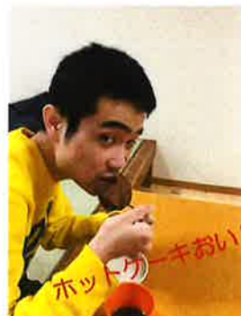
ホットケーキおいしいよ