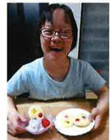
お家で、クッキー、美味しくできたよ♪