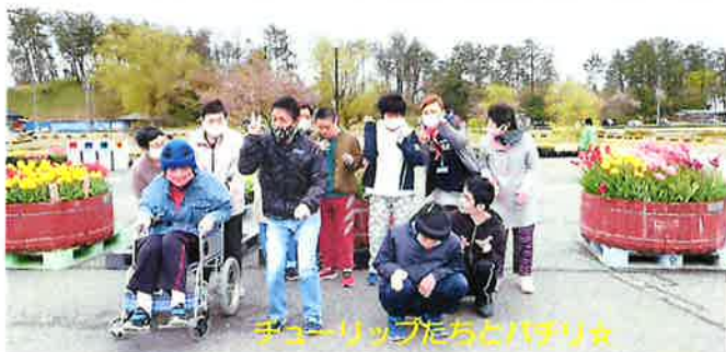
チューリップたちとパズリ☆