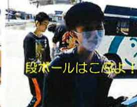
段ボールはこぼれ!