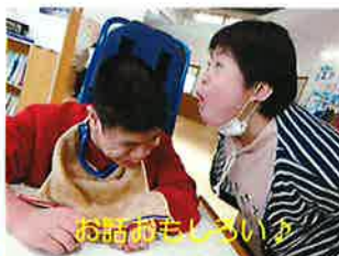
お箸がもじもじいカ