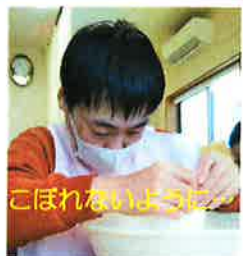
こぼれないように〜